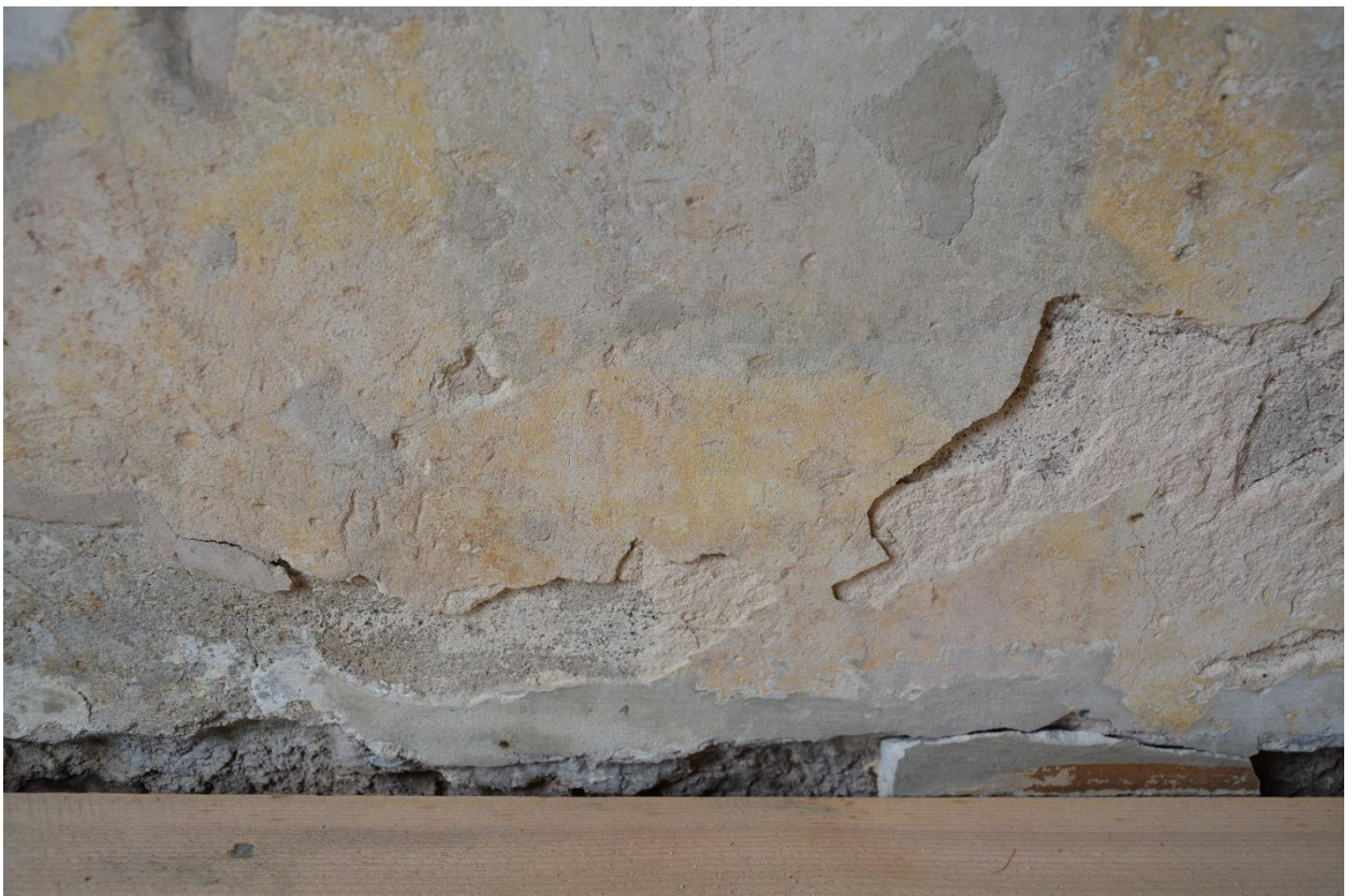
33. Северная стена, западная часть. Фрагмент. Отставание и утраты верхнего слоя штукатурного грунта, поверхностные загрязнения, темные реставрационные шпаклевки.