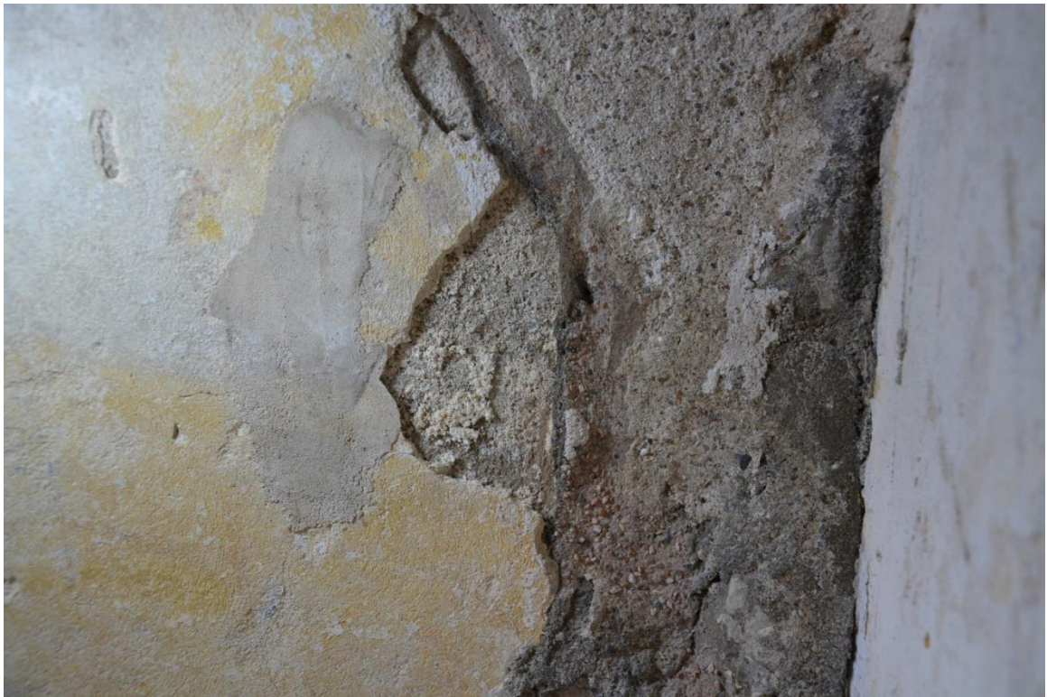
34. Северная стена, восточная часть. Фрагмент. Отставание и утраты штукатурного грунта, ямчуга, поверхностные загрязнения, темные реставрационные шпаклевки.