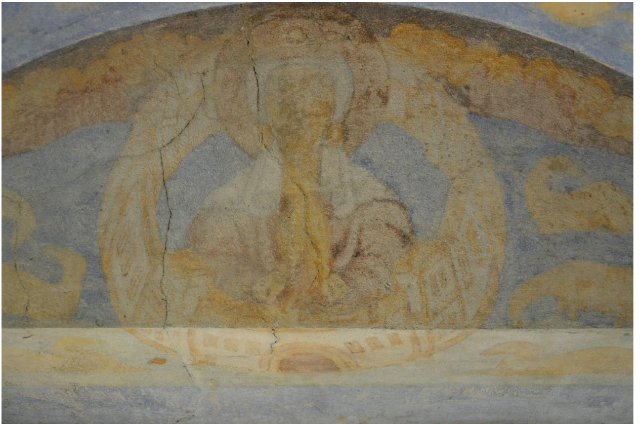
37. Северная стена. Фрагмент росписи над окном. Трещины, поверхностные загрязнения.