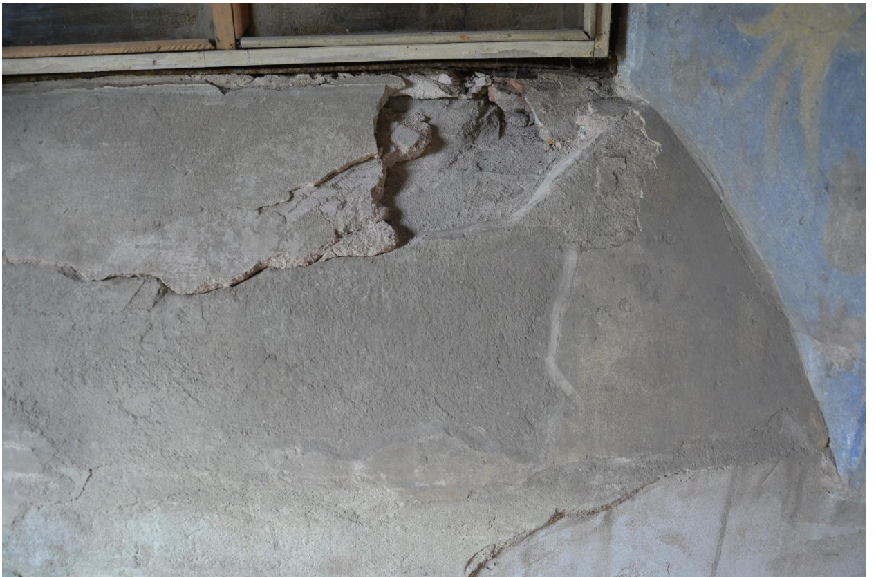
38. Северная стена. Подоконник. Утраты грунта и бортового крепления.