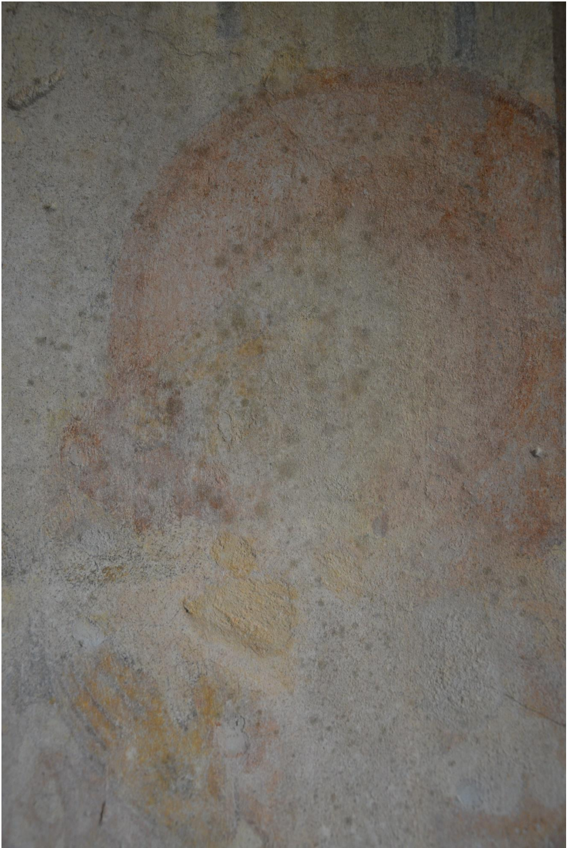
23. Западная стена. Северный откос. Колонии плесневых заражений.