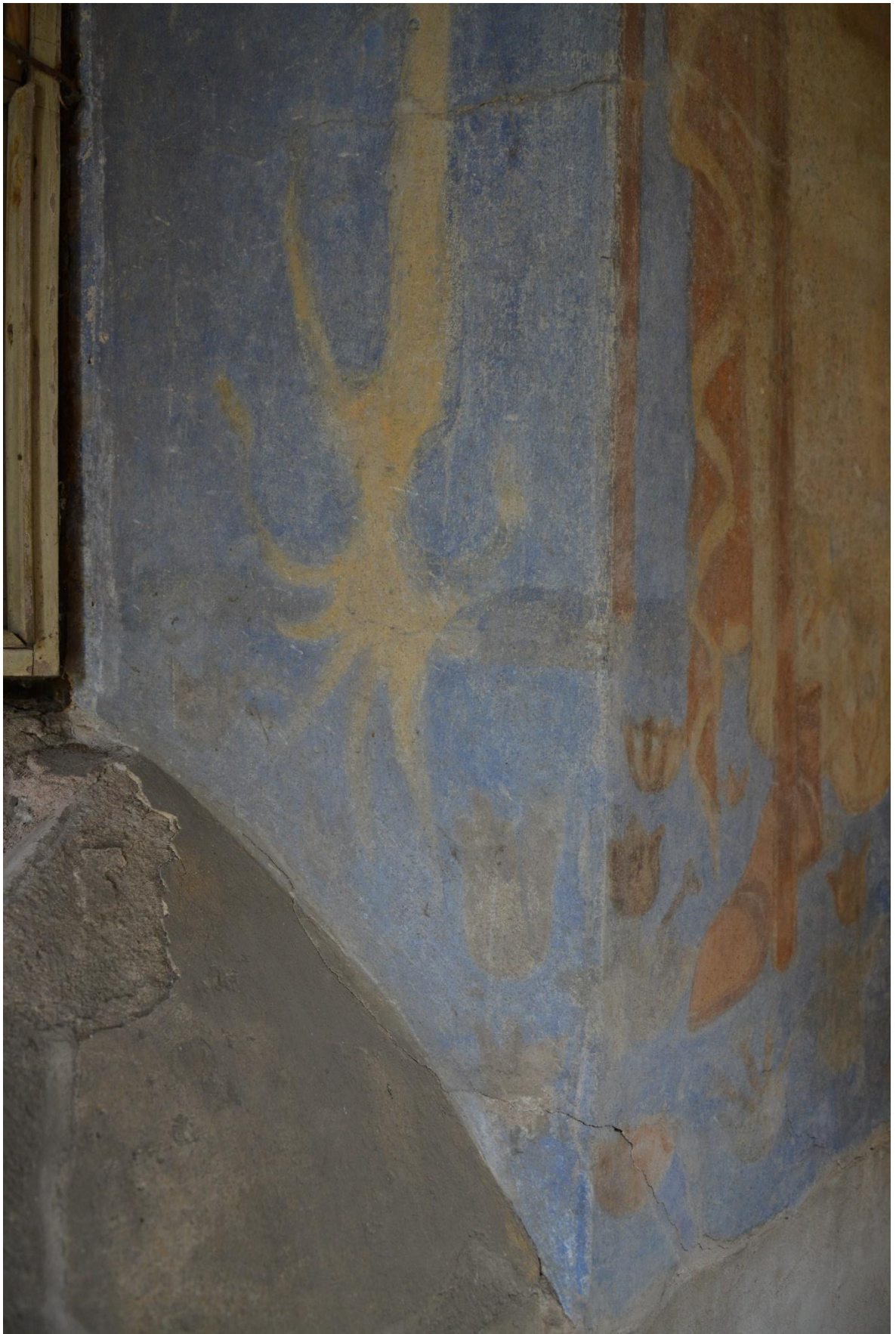
36. Северная стена. Восточный откос. Фрагмент. Трещины.