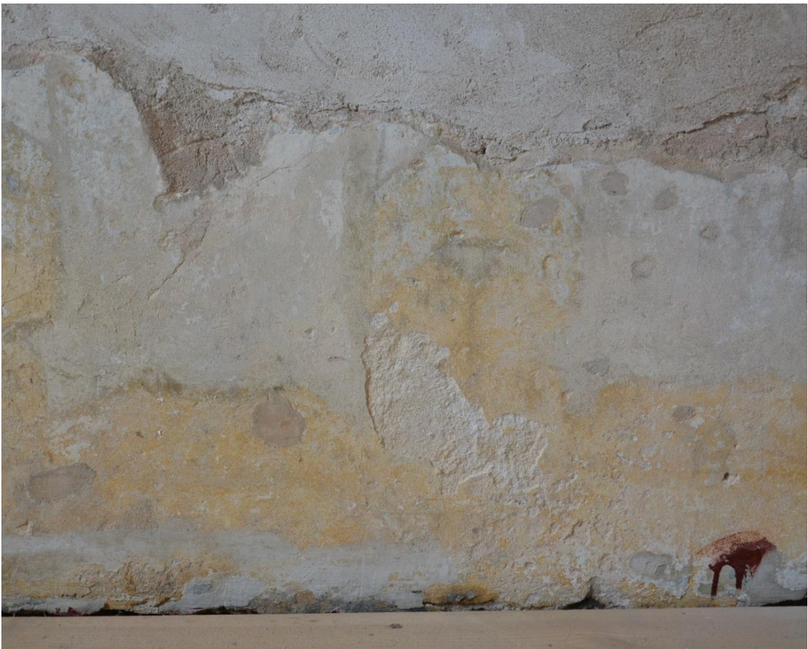
35. Северная стена, западная часть. Фрагмент. Деструкция, отставание и утраты штукатурного грунта, ямчуга, поверхностные загрязнения, поздние наслоения, темные реставрационные шпаклевки, меление красочного слоя.