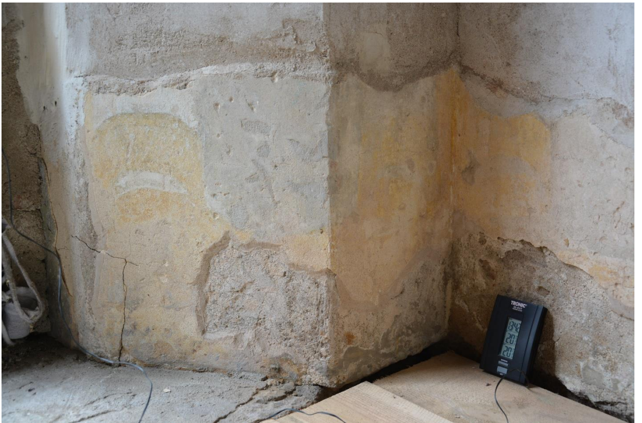
15. Западная стена. Северный откос. Фрагмент.