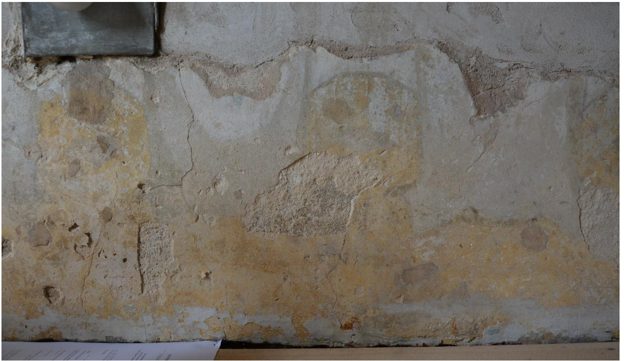
32. Северная стена. Нижний ярус росписи («полотенца»). Отставание и утраты (обрушения) верхнего слоя штукатурного грунта, ямчуга, поверхностные загрязнения, поздние наслоения.