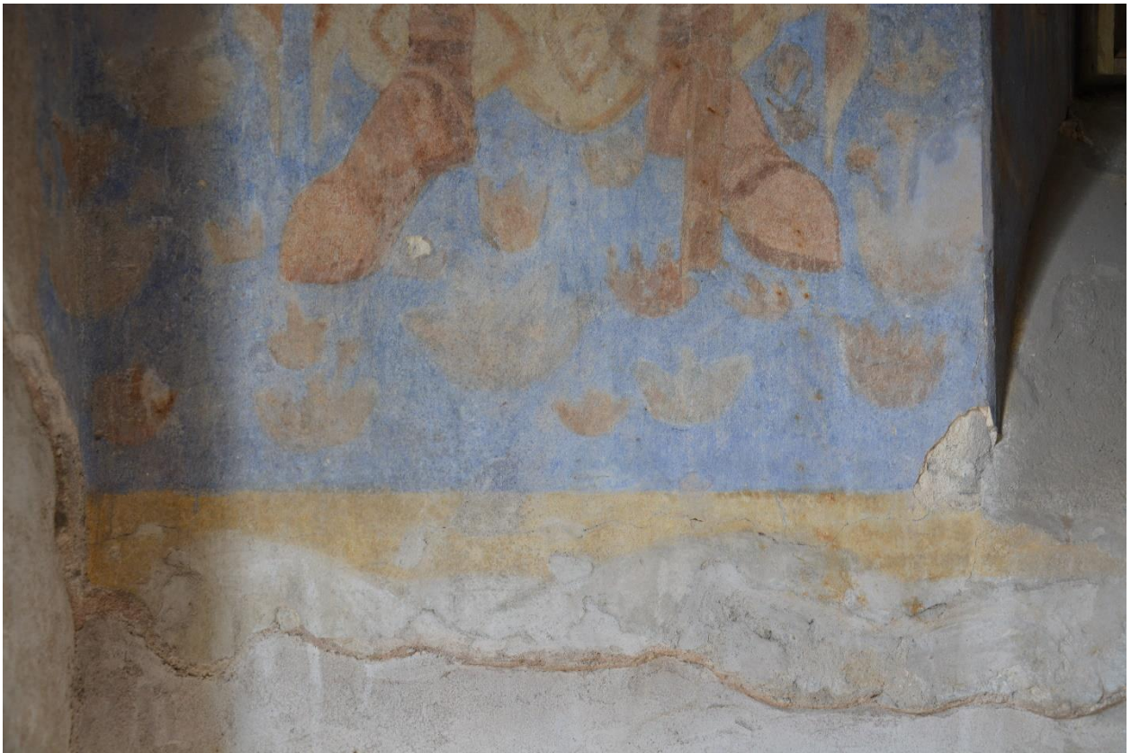
39. Северная стена. Фрагмент росписи. Поверхностные загрязнения, утраты авторского грунта с красочным слоем.