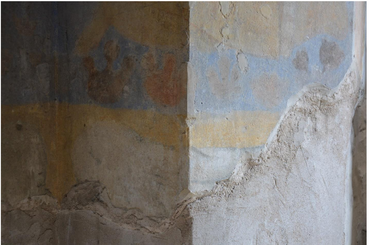
14. Западная стена. Южный откос. Фрагмент.