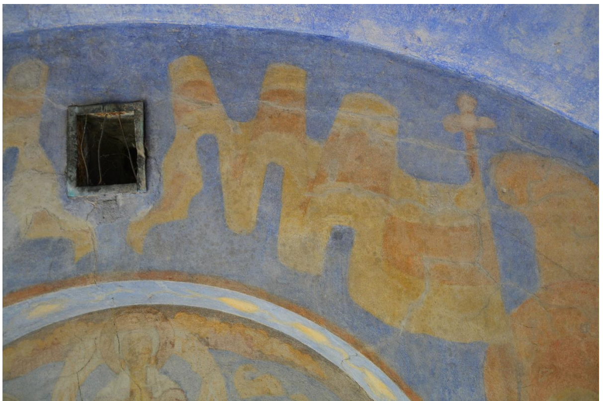
40. Северная стена. Фрагмент росписи. Участки плесневых заражений.